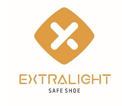
Logotipo do projeto