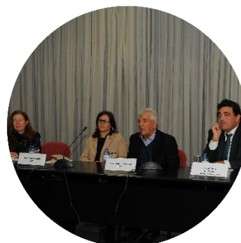
Sessão de abertura dos trabalhos 22/11/2017