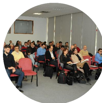
Sessão de abertura dos trabalhos 22/11/2017