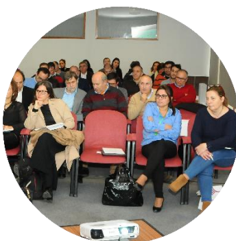
Sessão de abertura dos trabalhos 22/11/2017