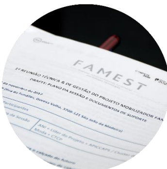
Sessão de abertura dos trabalhos 22/11/2017