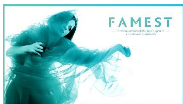
Logotipo e Imagem projeto