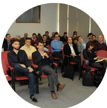
Sessão de abertura dos trabalhos 22/11/2017