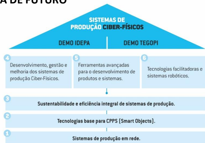
Figura 1 - Estrutura do Projeto