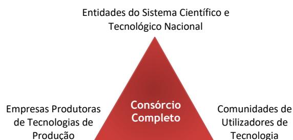
Figura 2 – Triângulo Virtuoso da Inovação Tecnológica